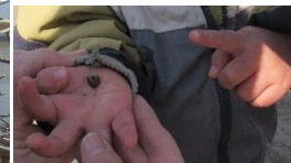
だんごむし いた! (園庭にて)